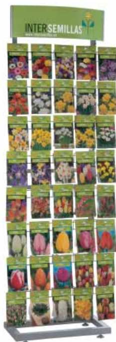
Expositores de 24 y 40 pinchos.